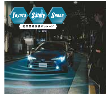
Photo:カローラ HYBRID WXB(2WD) ボディカラーはスーパーホワイトII(040) <220> <33,000円>はメーカーオプション、オプション装着車。 ■写真はカメラレコーダーの録画範囲内イメージです。 ■写真は合成です。 ■写真はカメラレコーダーの録画範囲内イメージです。

すべての方の安全をサポートするために、次世代の予防安全パッケージ"Toyota Safety Sense"を全車に標準装備しています。その他、個々の安全技術やシステムをさらに連携させ、さまざまなシーンでドライバーを支援。将来的には道路インフラとの協調、自車以外のクルマからの情報活用を回り、「事故を起こさないクルマ」の実現をめざしていきます。